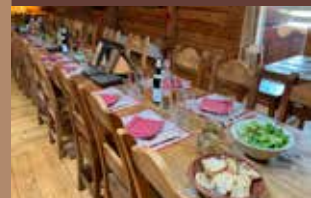
Accueil de groupes