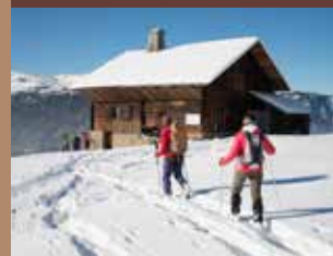
Balade en raquettes