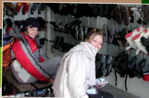
Salle pour sécher les chaussures de ski