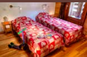
Chambre du 34