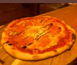
Pizzas à emporter