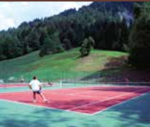
Terrain de Tennis