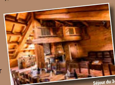
Séjour du 34