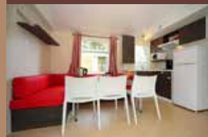
Vue générale Cottage «Gentiane

1 chambre avec 1 lit 2 places (140x190cm) - 1 chambre avec 2 lits simples (90x190cm), possibilité de les rapprocher pour un couple - une cuisine avec TV - wc séparé de la salle de bain.