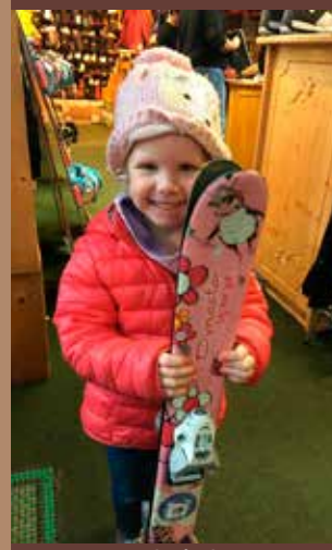
Le Magasin Gérard Sports