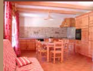
Cuisine du L32