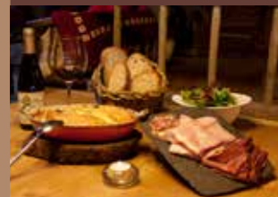
La Tartiflette au Reblochon