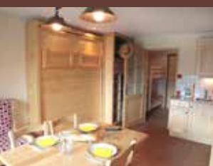
Pièce principale L03