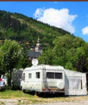
A 300 m du village