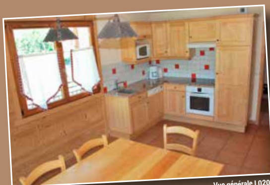
Vue générale L0207