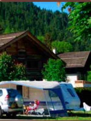
Un camping en montagne