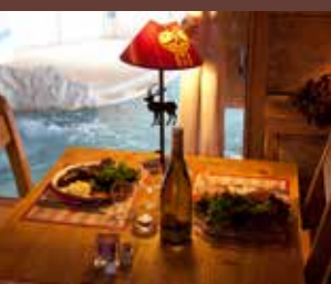
Restaurant sur place