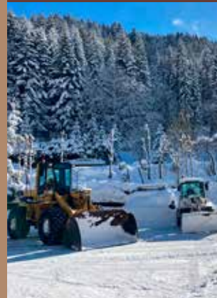
Nos engins de déneigement