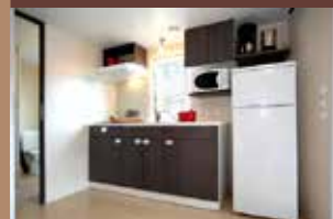
Cuisine du Génépi