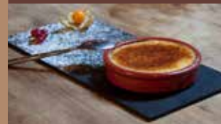
La Crème Brûlée Maison