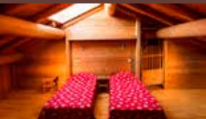
Chambre du 34