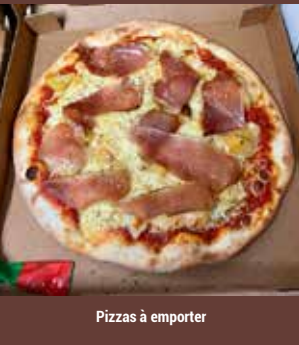
Pizzas à emporter

Bienvenue à La Ferme du Pépé. Partagez un apéritif Maison ou un vin chaud au bar. Savourez nos délicieuses spécialités : Reblochonade et Pêla des Aravis ainsi que nos plats originaux. Envie de profiter de vos vacances ? Optez pour la formule «plats à emporter» avec un grand choix de pizzas, frites et tartiflette.