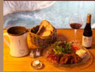
Restaurant avec vue sur la piscine