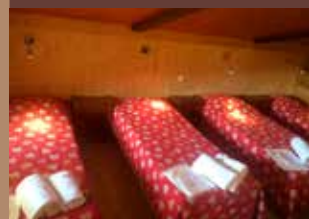
Chambre de l'appartement ref L17