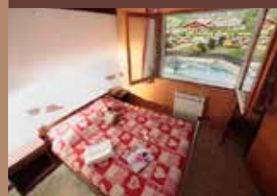
Chambre L17 Piel