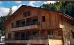
Chalet «Maison l'Escale»