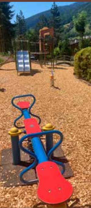
Terrain de jeux